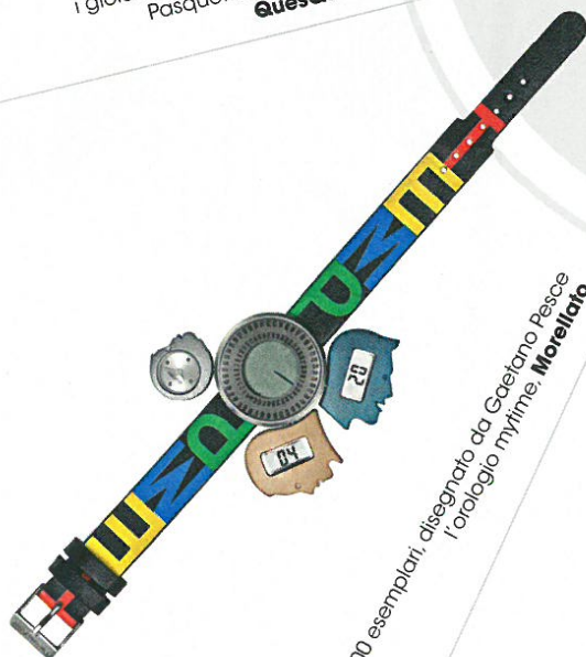
In 100 esemplari, disegnato da Gaetano Pesce l'orologio myrtime. Morellato