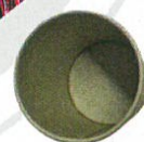
Porti di pic nic? Take-Away for Two. Essential

Materiali riciclati, arte, moda, tutto può essere occasione per reinventarsi con un pizzico di creatività