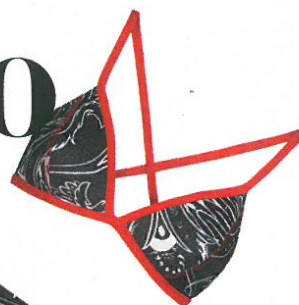
Costume due pezzi realizzato in tessuto riciclato. Jaked