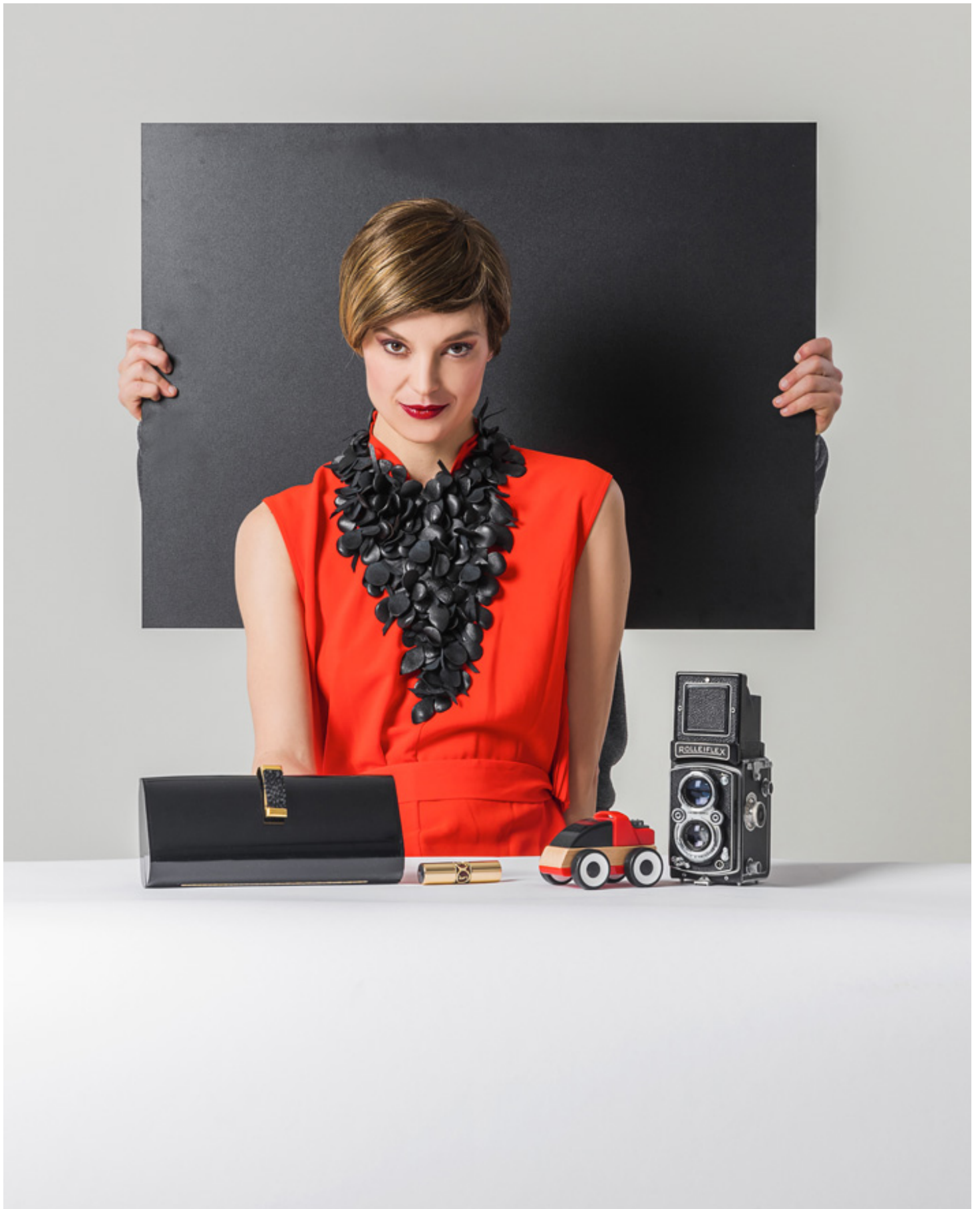
Collana nera quesQuello