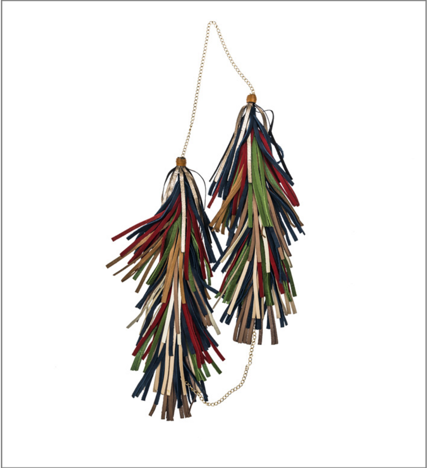
Collana con nappe colorate