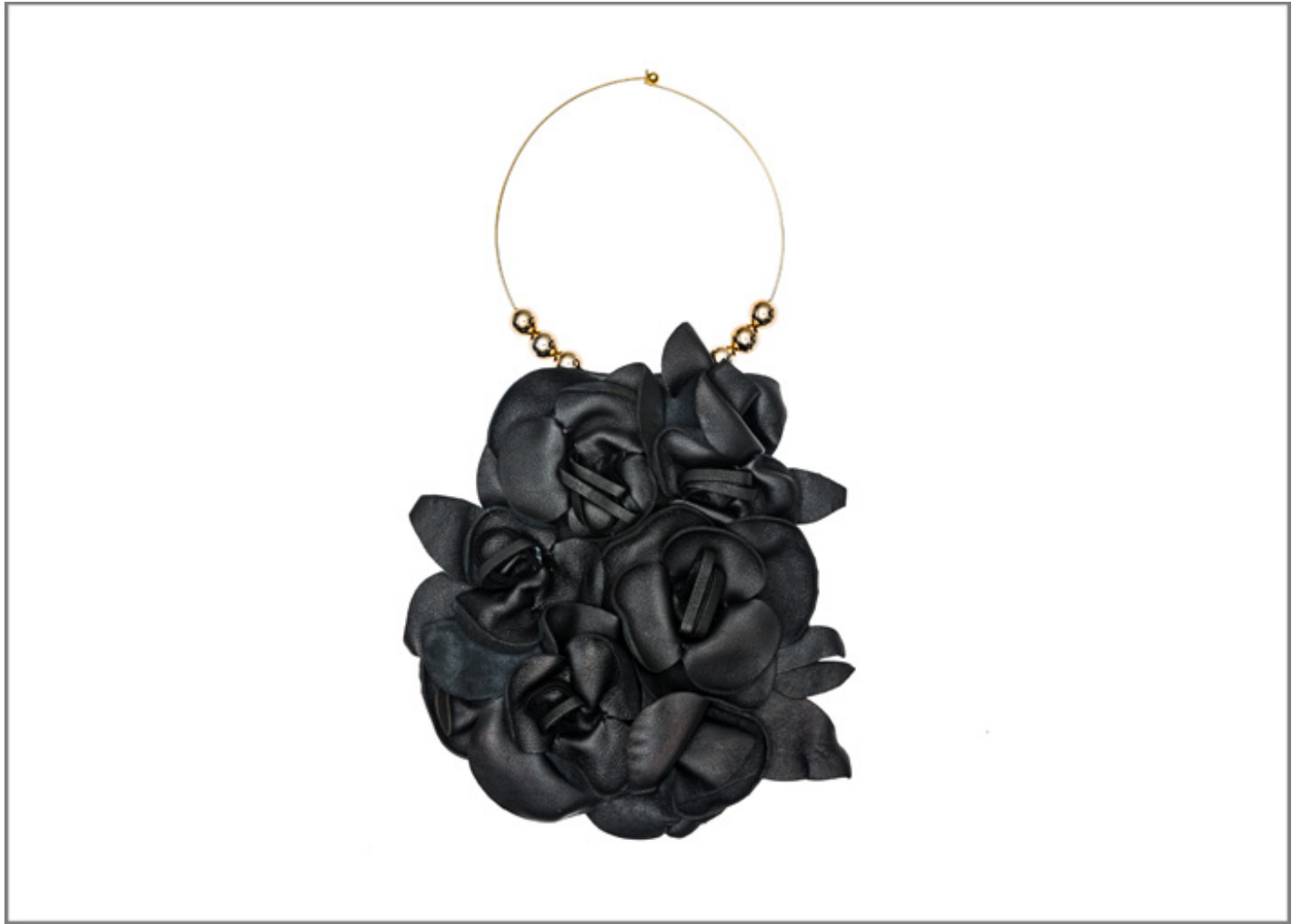
Collana con pelle nera quesQuello