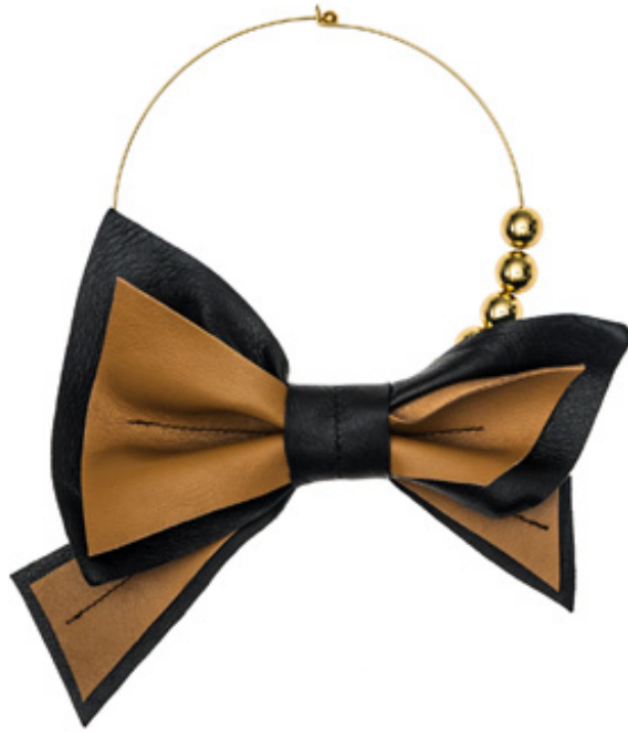
Polsiera con farfalla