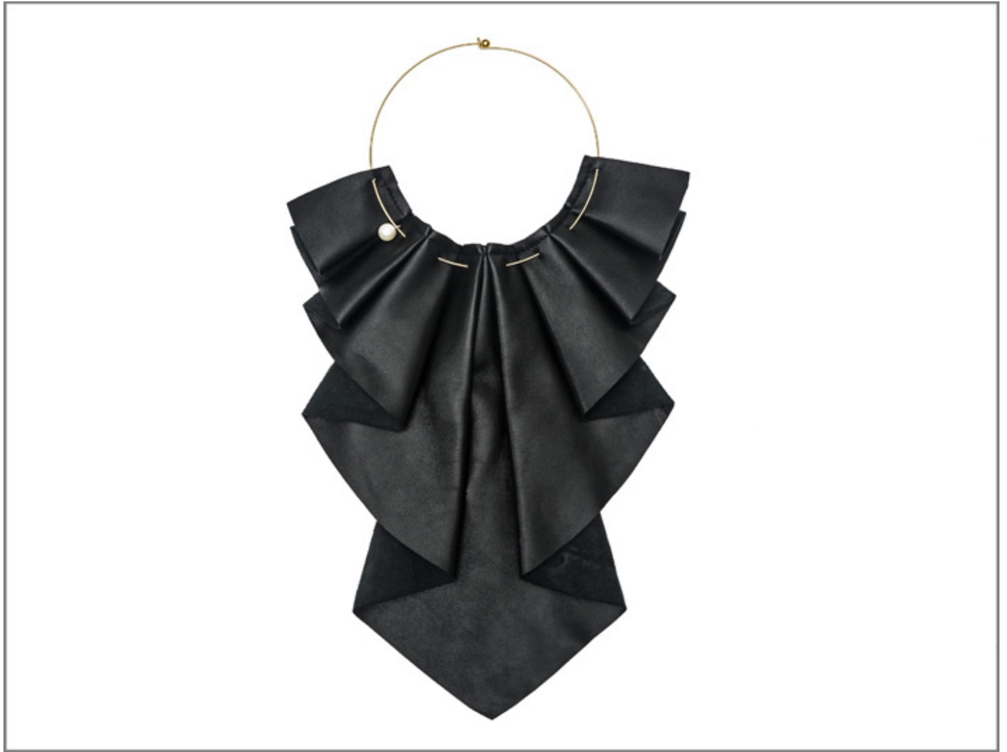
Collana con pelle nera