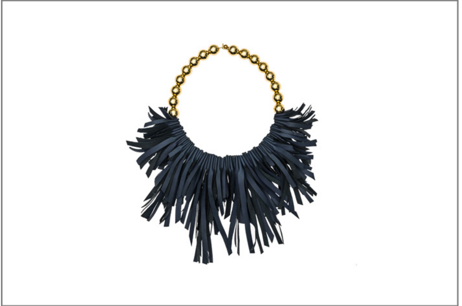
Design di Alessandra Pasquetti